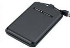
disco duro portátil